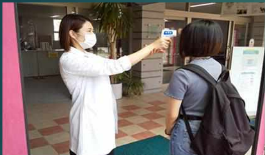
学生・教職員は毎日、検温を行います。なお、一般（学外）のみな様も検温にご協力下さい。

学生・教職員に対しては、毎日の検温を義務付けています。体調に不安がある場合は、保健室で対応します。また、事務局カウンターにはアクリル板を設置し、図書館等は、“3密”の防止に向けて、換気の上、間隔を空けて着席します。