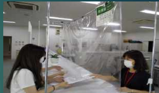
事務局カウンターには、飛沫防止シートが設置されています。また、教職員は、マスクを着用しています。