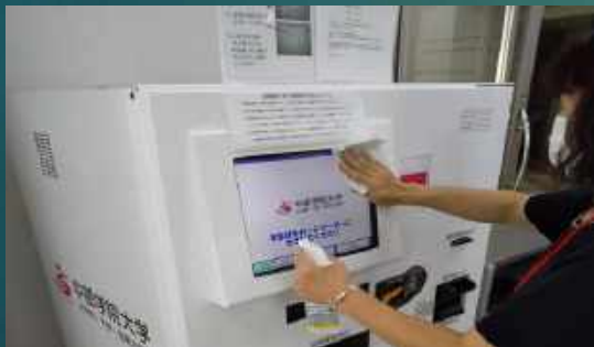
就職活動等に利用する「証明書発行システム」は、定期的に除菌を行っています。