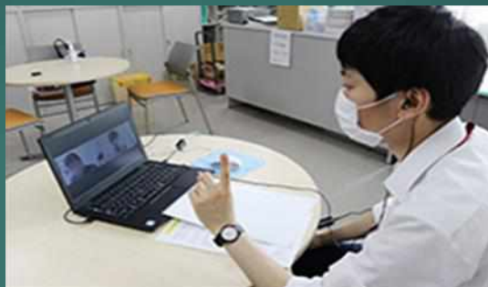
WEBによる模擬面接指導の様子です。