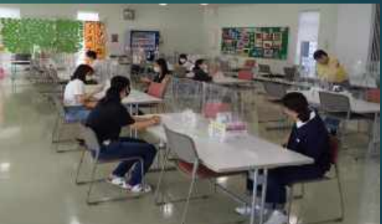
「学生ホール」等、学生のみなさんの休憩スペースはアクリル板を設置し、間隔を空けて着席します。