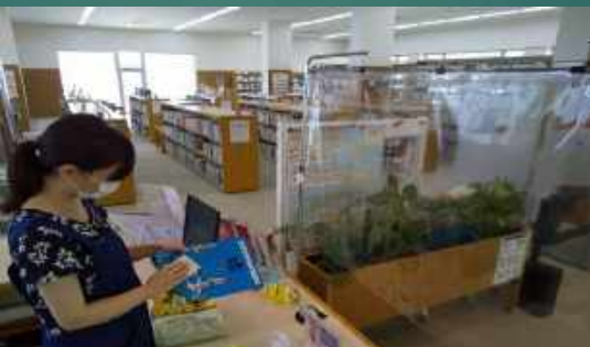
附属図書館の貸出資料・図書は、利用した都度、司書の職員が除菌しています。