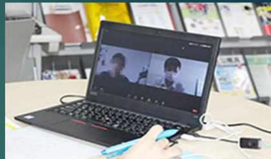
WEBによる模擬面接指導の様子です。

WEBを活用した面接・就職活動をサポートするため、定期的に連絡や情報提供を行っています。