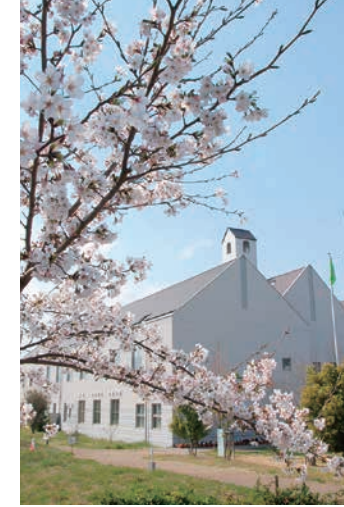
表紙/開設10年を迎えた各務原キャンパス