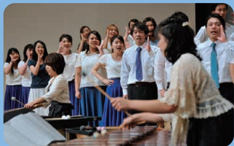
プロムナードコンサートでは、子ども学部子ども学科、短期大学部幼児教育学科の学生がハンドベルや合唱、パフォーマーを発表したほか、吹奏楽部は定期演奏会を前に、ダイナミックな演奏を披露しました。各務原市民会館