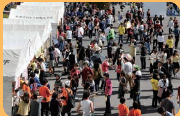
地域の皆さんと交流を深めた「たのしみん祭」と「大学祭」=関キャンパス