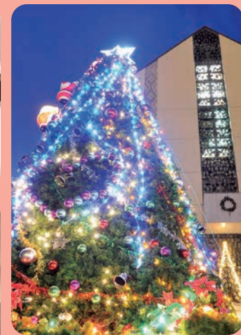
クリスマス礼拝と祝会を各キャンパスで行いました