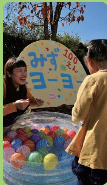
学生が主体となり、いろいろなイベントを企画した「学びの森フェスティバル」=各務原キャンパス