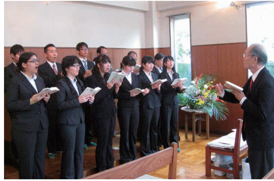
教会で賛美を奉仕するCCF

本学を卒業した元聖歌隊員が中心となり、2年前より再出発しました。現在は、学内で行われているチャペルアワーや近隣の教会で奉仕しています。きっかけは、新入生の女子学生が「なぜこの大学には聖歌隊がないのですか」と言っているのを聞いたからでした。「それならやってみよう」ということで思い立ちました。チャペルアワーの時