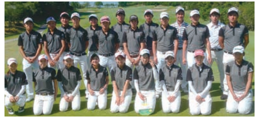
今年度も男女ともにさまざまな全国大会に出場したゴルフ部メンバー