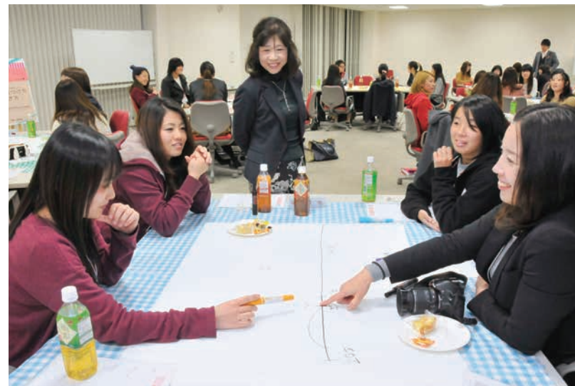
社会人女性と結婚や子育てなどについて交流を深めた女子学生

就活に備えてガイダンス、キャリア支援講座・科目など、さまざまなキャリアサポートを展開しています。