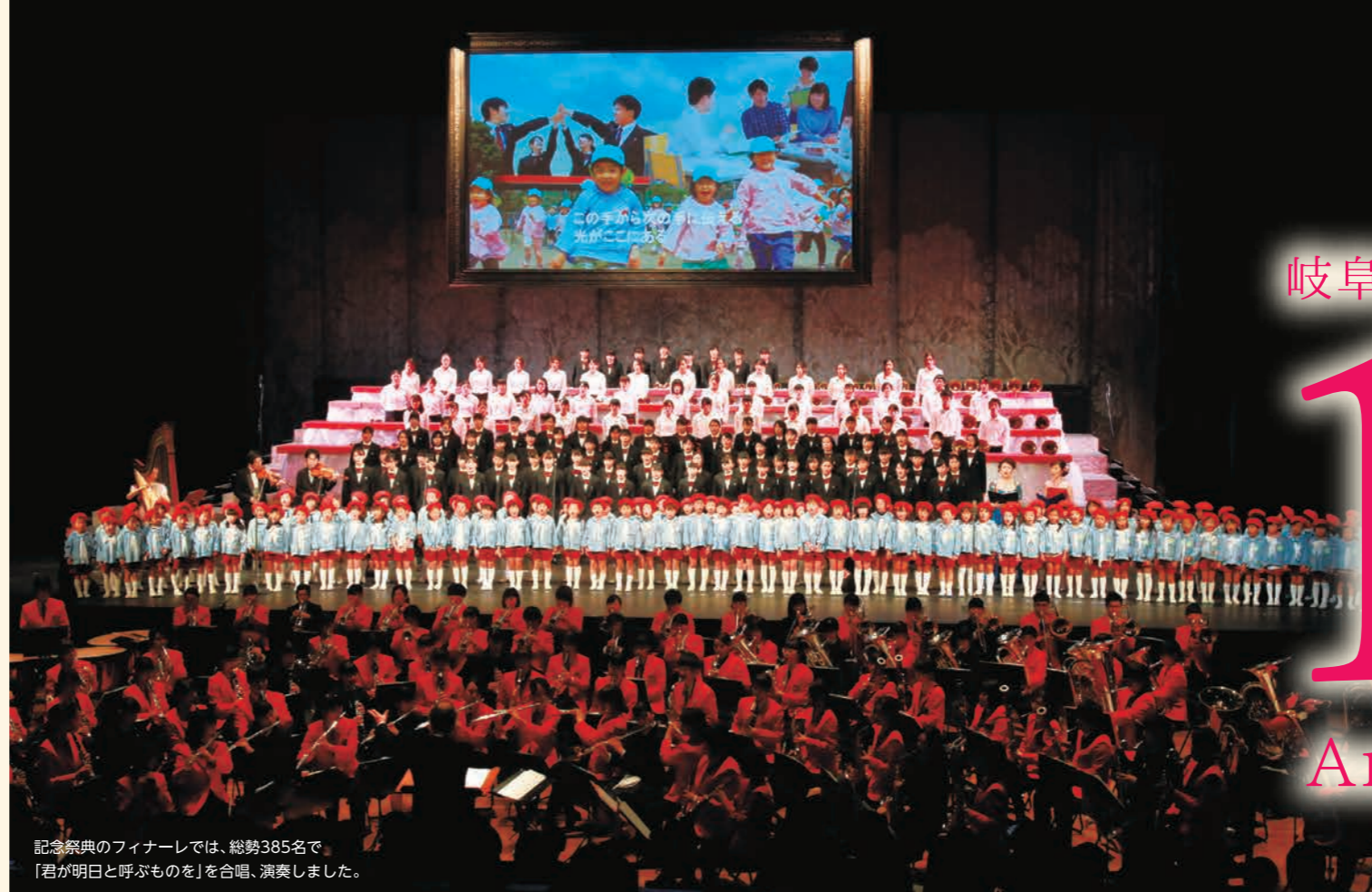
記念祭典のフィナーレでは、総勢385名で「君が明日と呼ぶものを」を合唱、演奏しました。

岐阜済美学院創立100周年記念祭典を11月25日、岐阜市の長良川国際会議場で行いました。「心の組曲『未来へのカンタータ』～ポロニアの丘の上で～」をテーマに、岐阜済美学院の在学生・在園児に加え、学院ゆかりの音楽家など、総勢385名による6章におよぶ音楽の祭典となりました。来賓、在校生や卒業生など約1100人が出席し、100年にわたり培ってきた「人づくり」を再認識しながら、未来への一步を確かめました。