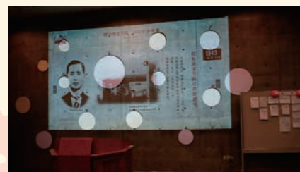
映像を交えながら、これまでの歴史を振り返りました