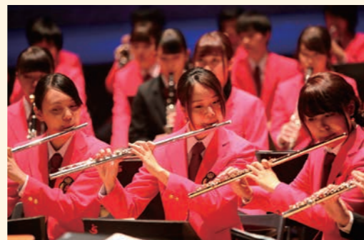
吹奏楽部による演奏