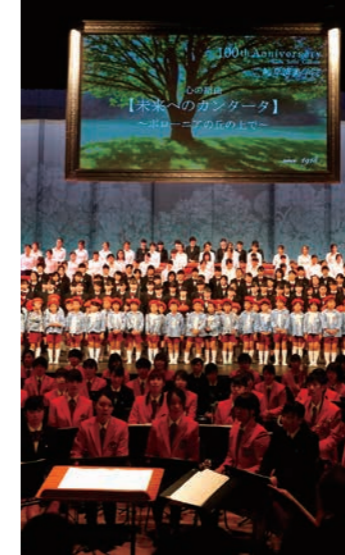
表紙/学校法人岐阜済美学院100周年記念祭典の様子より

介護の日を前に、人間福祉学部と短期大学部社会福祉学科の学生が、介護をしている人にバラの花を贈り、啓発活動を行いました。学びの森、JR岐阜駅