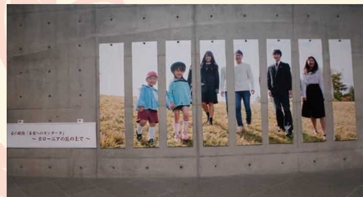
「岐阜済美学院はひとつ」を象徴する園児、高校生、大学生の写真パネル