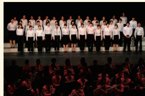
聖歌隊による合唱