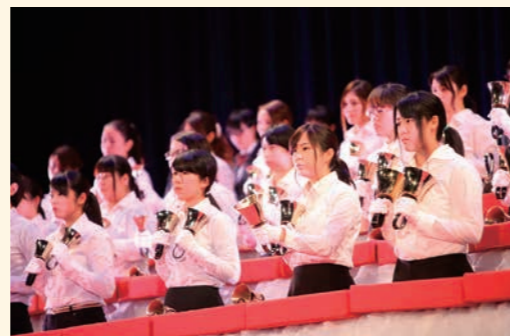
ハンドベルクワイアによる演奏