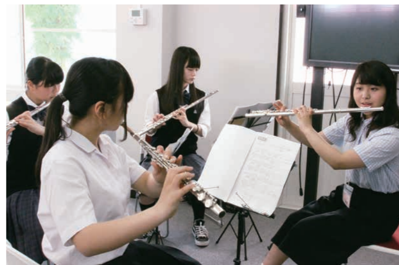
シティカレッジ関での吹奏楽講座の様子

吹奏楽部は毎年コンクールに出場しています。コンクールに出場できる人数の上限は55名で、指定された課題曲と任意に選曲できる自由曲を12分間のなかで演奏し、審査を受け