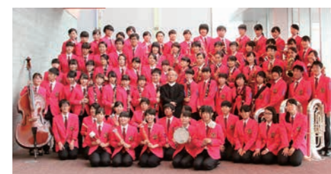
吹奏楽部のメンバー

す。吹奏楽部顧問の先生方からは、なかなか時間が取れず、新入部員に楽器の指導をしてあげら