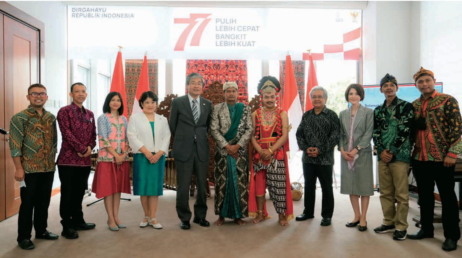
インドネシア教育大学との連携協定調印式より=東京都新宿区、インドネシア大使館