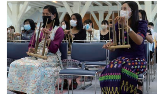
インドネシアの伝統楽器「アングルン」の合奏に臨む学生ら