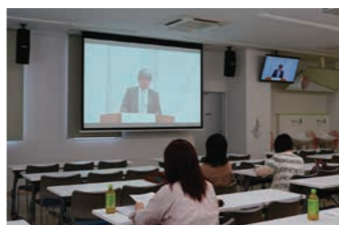
チャペル・アワーの様子