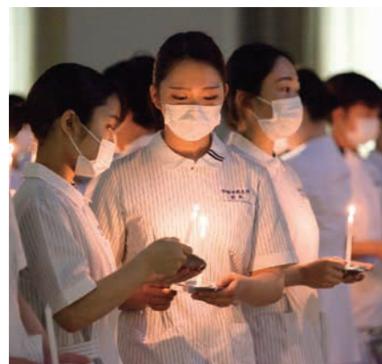
表紙写真 実習を控えて行われた看護学科の戴灯式より =関キャンパス・グレースホール

学校法人岐阜済美学院は1918年の創設以来、100年を超える歴史を重ねてきました。