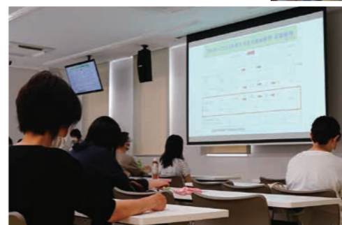
看護学科別集会の様子