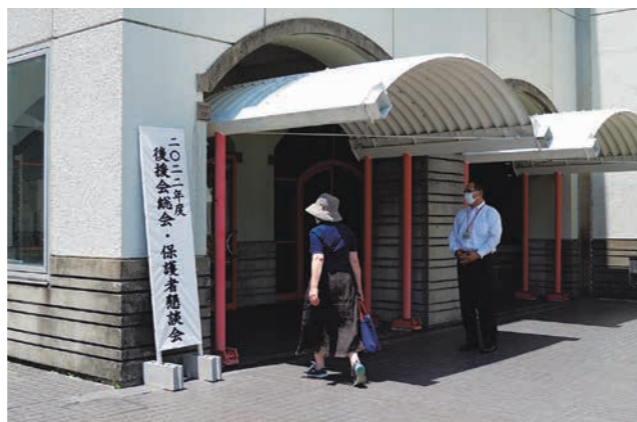
関キャンパス会場入口の様子

6月4日(土)、関・各務原両キャンパスにおいて「2022年度後援会総会・保護者懇談会」を開催しました。過去2年間はオンラインでの開催となり、後援会総会は中止となっていました。今年、本学会場での対面もしくは各ご家庭からのオンラインでの参加を選択いただける形式での開催となり、対面参加、オンライン参加合わせて、約170名の保護者の方々が参加されました。なお、後援会総会・保護者懇談全体会は新型コロナウイルス感染症対策として事前録画にて各学科ごとの会場で視聴していただきました。