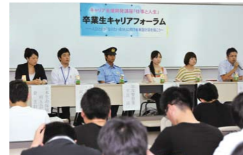
パネリスト(大学) ※写真右から

参加した学生からは「福祉のスペシャリストになりたいと強く思い、今まで以上に国家試験合格に向けて勉強しようと決めました」「仕事を続けていくと仕事のやりがいや面白さがわかってくると知った。一生続けられる仕事に出会えるよう就職活動したい」など、積極的な意見が聞かれました。なお、今年度の「卒業生キャリアフォーラム」は、就職活動時期の後ろ倒しに合わせて後期に開催します。