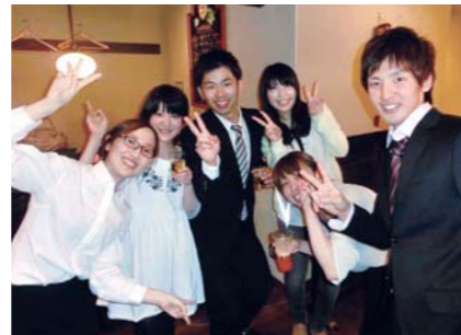
理学療法学科OB・OG会後の懇親会

企画できるように「頑張るぞー (-_-)」と感じています。そして、これからも理学療法学科卒業生の親睦を深め、お互いにかち合いながら成長していきたいと思えます。