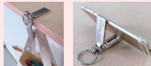
ノベルティーグッズ(バッグハンガー、スマホスタンド)

同窓会協力金は、同窓会予算に充当させていただき、より充実した同窓会活動に活用させていただきます。ご協力をよろしく願いたします。なお、3口以上の協力金を納めていただいた方には、昨年度作製しましたノベルティーグッズを後日お送りいたします。