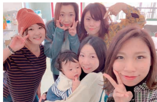
学びの森フェスティバル「卒業生サロン」にて

学びの森フェスティバルの時(11/3)にサークルの仲間と集まりました。久しぶりにラ・ルーラの皆さんやお世話になった先生にも会えて楽しかったです。この日に合わせて飛行機で飛んで来てくれた仲間もいて、お互いに近況を報告したり学生の時のようにはしゃぎました。また先輩や後輩にも会えた幸せな一日でした。来年も大学に遊びに行きたいです。