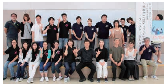
2016年の地域手話サークルのイベント、卒業生が6人参加

本学の手話サークルは通年、学内外問わず様々な活動をしています。OB会としても、地域の手話サークルのイベントの参加などで久々の顔ぶれが揃うことがあります。その際には、手話を使って近況報告するなど、卒業をしても手話を学ぶ仲間なんだ、と感じることが多くあります。