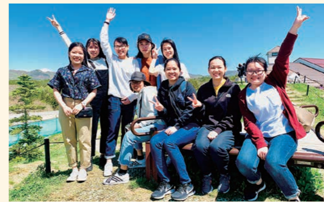
社会福祉学科・新入生宿泊研修より