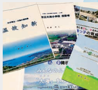
作成した郷土史など