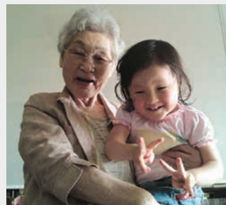
梅村先生とわが子