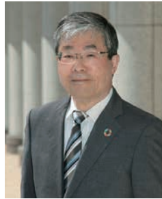
大学学長 江馬 諭

また、福祉施設(介護等)、医療施設(看護、理学療法)、教育施設(幼稚園、保育園、小学校)、スポーツ関連施設は、地域に必要な社会的要素であります。本学を卒業された皆様が、このような福祉施設などで働かれ、地域の一員として活躍されている姿は、地域コミュニティの理想的な一つの姿ではないでしょうか。本学は、卒業生の皆様が地域で活躍されていることを大きなよりどころとして、今後も地域に必要な人材養成を継続してまいります