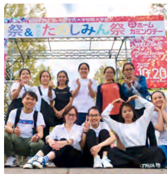
大学祭たのしみん祭