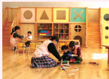
ラ・ルーラ(各务原校区内)