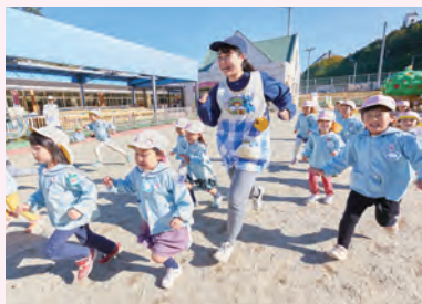
桐之丘幼儿园(关校区内)

关校区内设有桐之丘幼儿园、各务原校区设有ラ・ルーラ(儿童家庭支援中心)。此外,还有常磐保育园、附属幼儿园、岩野田儿童中心等充分的实习环境,可与孩子们近距离地接触。