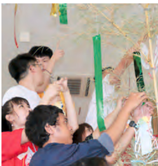
日本文化七夕节体验