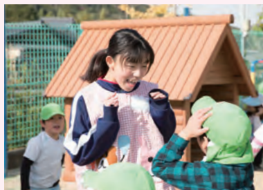
常磐保育园(岐阜市)