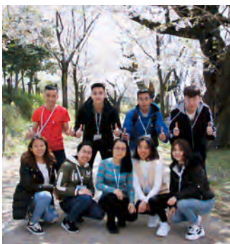
入学典礼 赏花活动